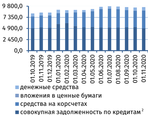
Рис. 3. Динамика основных видов активов, млн руб.

руб. (рис. 4). Продолжился рост потребительского кредитования: задолженность физических лиц возросла на 5,6 млн руб. (+0,5%), до 1 129,7 млн руб.