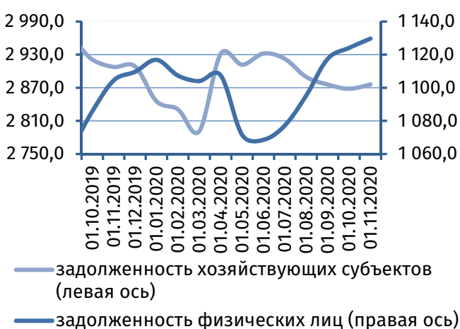
Рис. 4. Динамика задолженности по кредитам, 2 млн руб.

Результаты деятельности коммерческих банков республики в октябре 2020 года характеризовались формированием чистой прибыли в сумме 8,8 млн руб. (в сентябре 2020 года – 11,7 млн руб.).